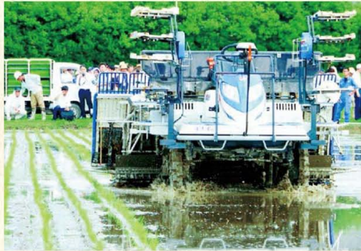
農研機構が披露したロボット田植え機 リモコンで発進停止、速度を指示する

農 研機構・農業技術革新工学研究センターは7月6日、埼玉県鴻巣市で移植作業が無人化できるロボット田植え機を披露しました。高精度なリアルタイム衛星測位システム(RTK-GNSS)を使い、熟練者並みの真つすぐな移植ができます。作業者は畦(あぜ)から田植え機に苗を供給します。作業人数が減らせ省力化につながります。実演会では、実用化に向けて農家や農機メーカーと意見を交わしました。