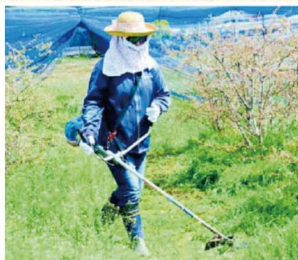
刈り払い機による事故の原因別割合

飛散した小石の威力が最も高かったのは、4枚刃。最大時速約130キロで、67・8センチまで飛びました。10