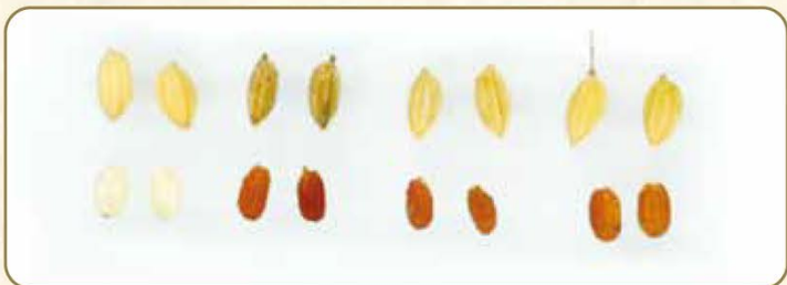
通常の「コシヒカリ」(左)と雑草稲。雑草稲は(左から)もみの黒っぽい系統、色の薄い系統、玄米の胴が幅広い系統