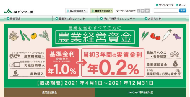
農業者の皆さまへ