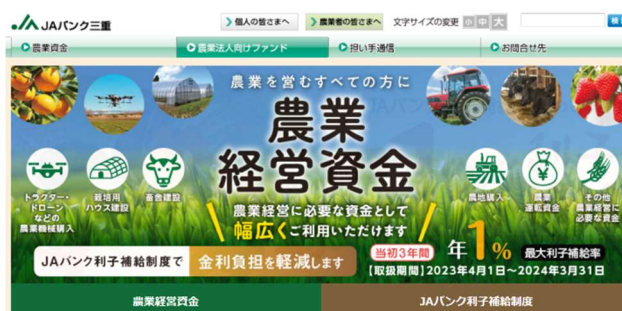
農業者の皆さまへ