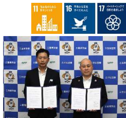
(三重県警察との協定の締結)

J Aバンク三重では、令和7年8月に三重県警察と「金融犯罪に係る被害防止等に関する情報連携協定」を締結し、金融犯罪の未然防止や被害の拡大防止に向け、連携した取組みを行っています。