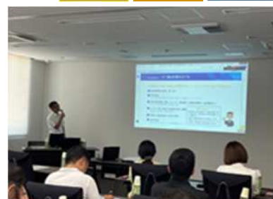
（輸出商談スキルセミナーの様子）

当会は、三重県内の農林水産事業者や食品関連事業者を対象に、販路拡大に向けた輸出意識の醸成等を目的として、令和７年８月に「輸出商談スキルセミナー」（ジェトロ三重貿易情報センターと共催）を開催しました。また、輸出コンサルタントと連携し、事業者ごとの課題に応じた個別相談やアドバイスを実施するなど、具体的な輸出計画の実現に向けた支援を行いました。