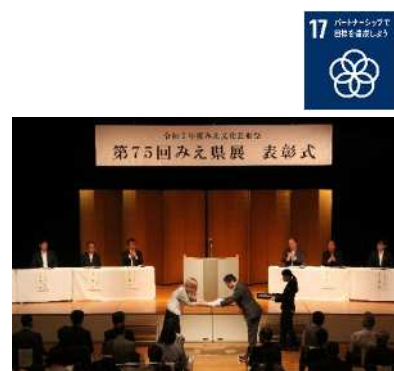
(「for your Dream賞」の贈呈)

J Aバンク三重では、三重県の文化芸術の発展に資するため、「第75回みえ県展」に協賛し、令和7年5月に開催された表彰式において、日本画・洋画・彫刻・工芸・写真・書の6部門の優秀作品に対し、「for your Dream賞」を贈呈しました。